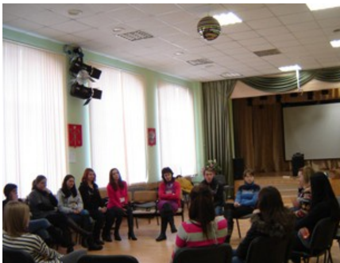
Знакомство. День первый

Как помочь нашим выпускникам не попасть в это число, а найти своё место на рынке профессионального труда? С этой целью наше учреждение заключило договор с Фондом социального развития и здоровья «ФОКУС-МЕДИА» на участие в проекте «Развитие личностных и коммуникативных навыков студентов средних специальных заведений для улучшения их конкурентоспособности при устройстве на работу».